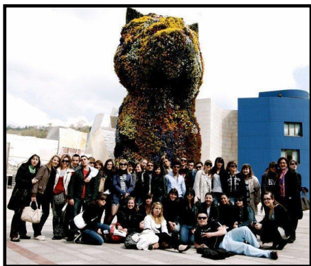
sculptures à l'air libre: Chillida Leku.

Les 1ères et les terminales européennes ont effectué un voyage d'étude au Pays Basque, du 6 au 10 avril, voyage qui aurait dû avoir lieu du 7 au 12 mars mais qui avait été reporté à cause de la... tempête de neige qui a sévi dans le sud de la France et le nord la péninsule ibérique. Au programme de ce séjour, les élèves ont pu se rendre à San Sébastian mais aussi visiter la ville de Guernica, son musée de la paix et son arbre (emblème officiel de Biscaye).