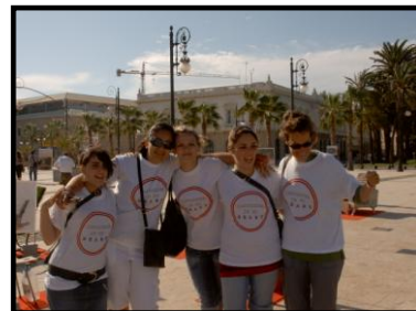
Les élèves accompagnées de leur professeur visitant la ville