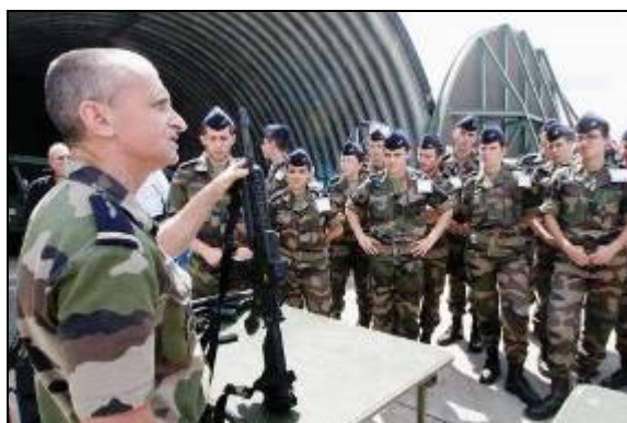
Figure 3 – Réservistes à l'instruction.