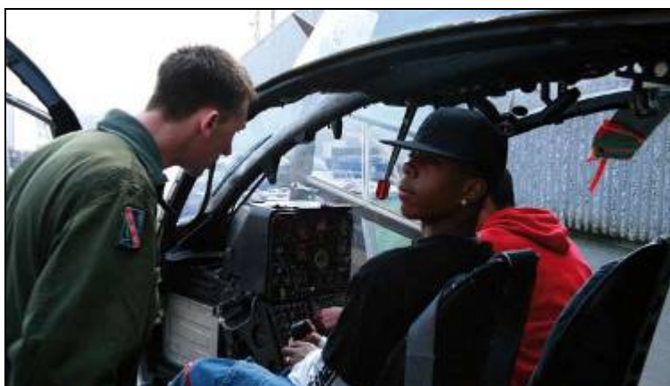
Figure 3 – Les RLJC participent à la promotion des forces armées.