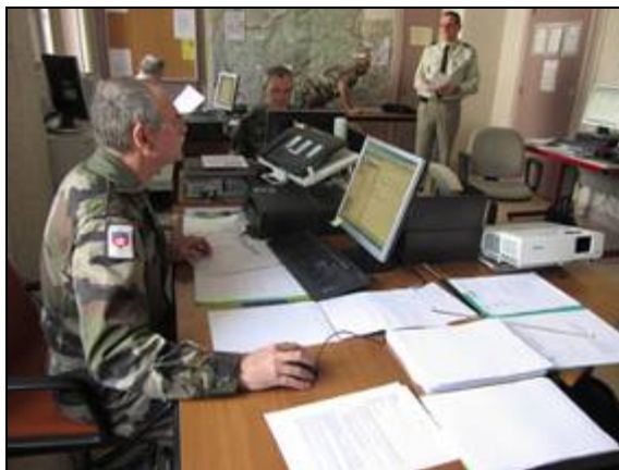
Figure 4 – Un centre opérationnel de DMD.