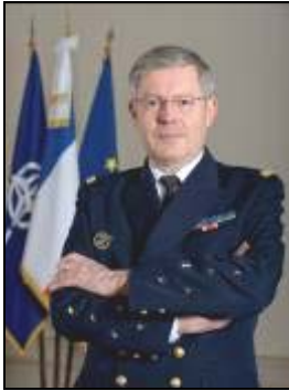
L'Amiral Édouard GUILLAUD Chef d'état-major des armées (CEMA)

Paris, le 26 juillet 2012 N°D-12-007731/DEF/EMA/SCEM-RH/DIAR/NP