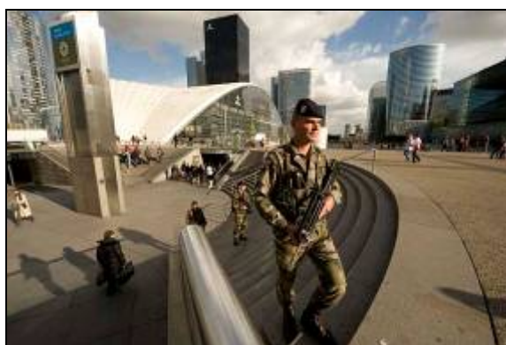
Figure 1 – Patrouille VIGIPIRATE à la Défense.