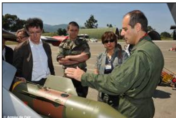
Figure 2 – Information de Réservistes citoyens.