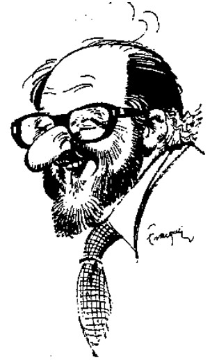
Caricature de Jijé par Franquin. 1965 -1967

Invitation chaleureuse aux amateurs... !