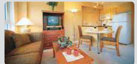
Un hébergement confortable, situé dans le centre-ville