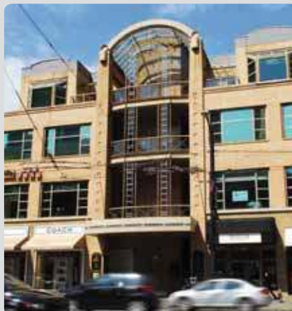
Etudiez dans le centre de Vancouver, proche des plages

Kaplan PLI Vancouver Suite 300, 755 Burrard Street, Vancouver, British Columbia, V6Z 1X6