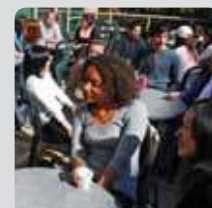
Profitez de la terrasse ou travaillez dans le centre d'étude