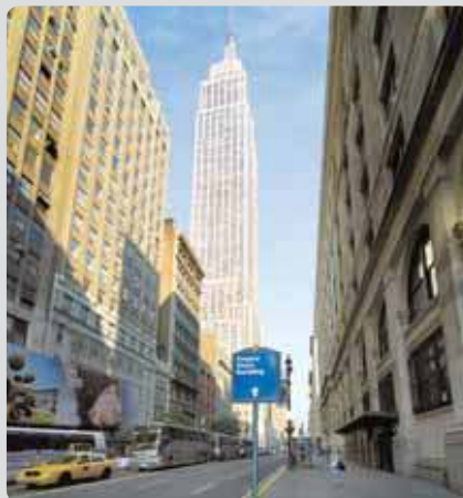
Etudiez au cœur de New York

Pour connaître les tarifs, veuillez suivre ce lien