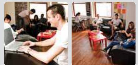
Equipements modernes et espace de détente agréable