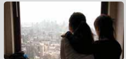
Vue spectaculaire depuis l'école